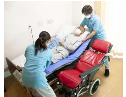
ベッド・ティルトリクライニング車いす