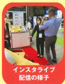
インスタライブ 配信の様子