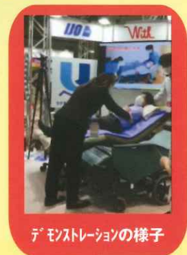
デモンストレーションの様子

ステージ上で新商品の紹介を行っていたのですが、興味を持っていただいている方が多かったのか実演を始めると、すぐにお客様が立ち止まって見ていただけました。特に、施設や訪問リハビリの職員様など、現場で直接ご利用者と接する方が多かったように感じました。実演中に、移乗に関する現在の問題点を説明していると、大きく頷かれる方や、「こんな商品が欲しかった」と言っていたことがあり、実際に滑らせて移乗するところを実演すると、滑りの良さにみなさん驚かされていました。お客様に体験もしていただき、思ったより軽い力で行える点や、ボードの抜き差しや、持ち運びが簡単で取り扱いがしやすい点が好評でした。直接お客様の反応を見ることができ、実際の現場の様子や課題を聞くことができ、改めて新商品が現場のニーズに沿った商品だと認識することができました。