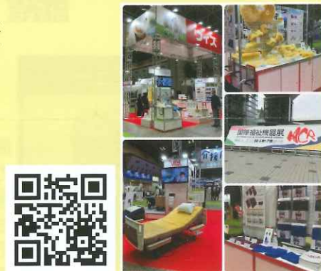
【動画】展示会の様子