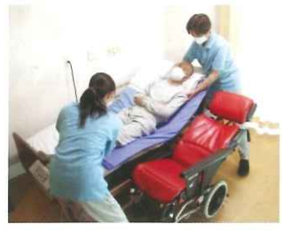
ベッド～チルトリクライニング車いす