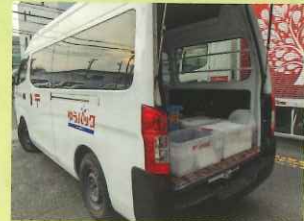
郵便にてお客様の元へお届けします