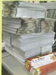
間違いのないよう確認しながら封詰めをしています